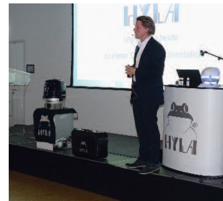
... die Vorzüge des bahnbrechenden Hyla-Konzepts